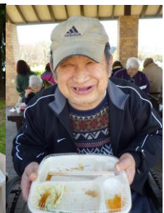
お腹いっぱい？良い笑顔です♪