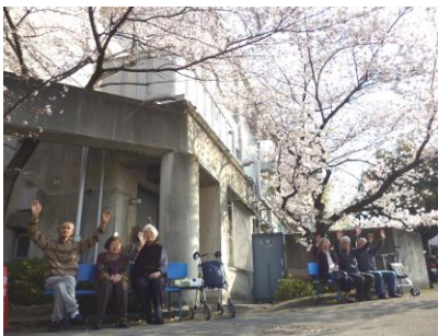
ケアハウスの桜の下で…

今年の桜は雨が多く、なかなか外に出る事が出来ませんでした。 それでも、皆さんの日ごろの行いのおかげ？！花見ツアーの日には良い天気にも恵まれました。 花より団子？桜に花見弁当、おやつと楽しんでいただいた皆さんの写真が盛り沢山！ 今月号は写真をたくさんご覧下さい！！