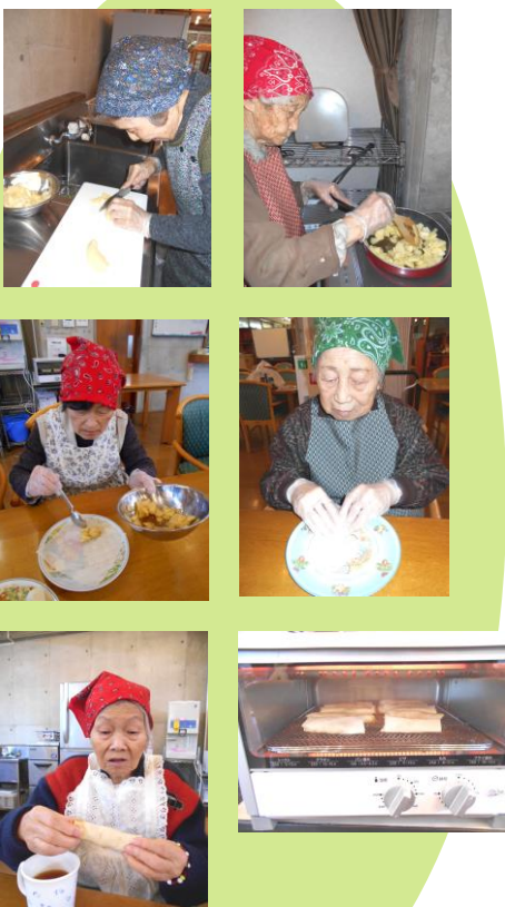
春巻きの皮で作ったアップルパイ。こんがり焼けた熱々を！