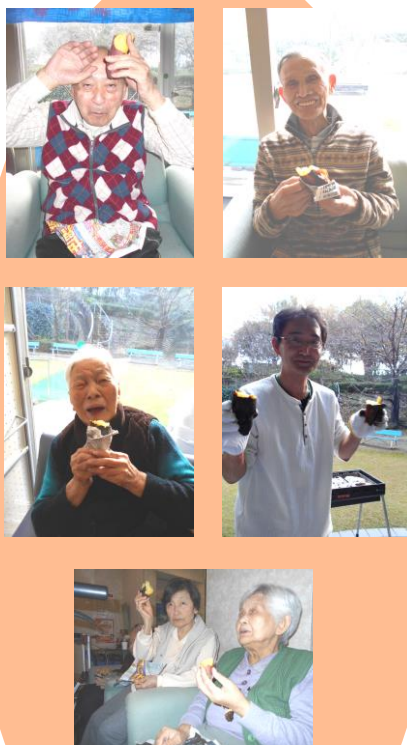
甘いわ～ 美味しいわ～ と思わず笑顔がこぼれます♪