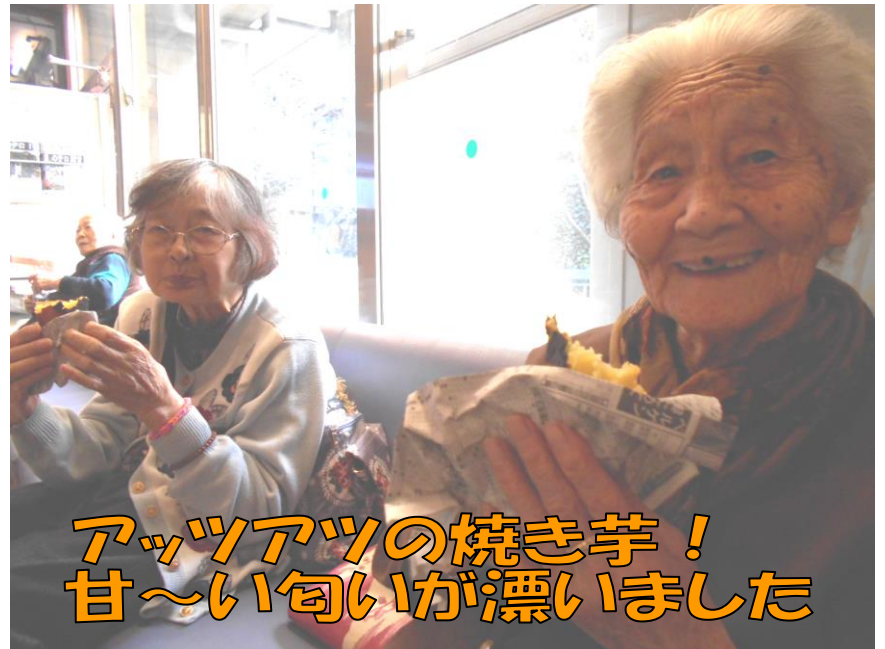
アツアツの焼き芋！ 甘～い匂いが漂いました