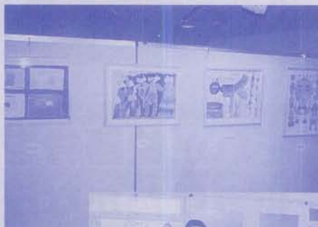
育成苑と合同美術展