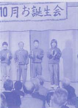
10月お誕生会 らぎホームにて