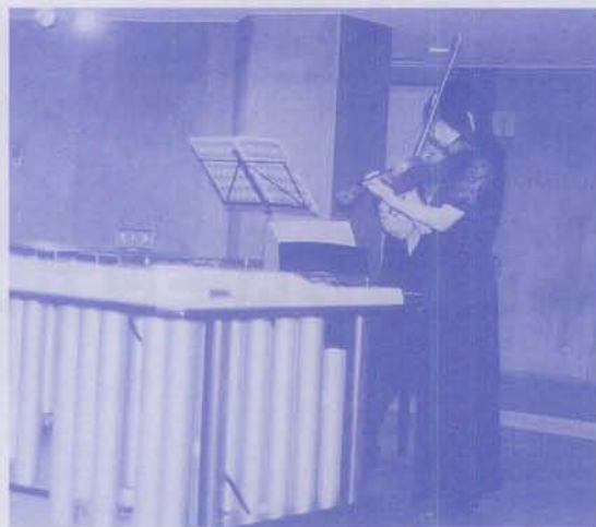
ミニコンサート 文化ホールで開催