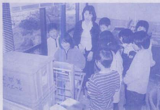
さをり織 小学生が見に来ました