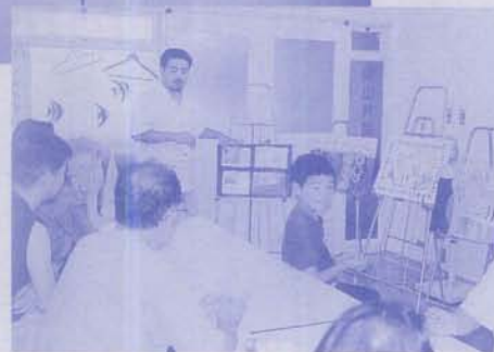
絵画教室 江藤先生の批評をうけてます