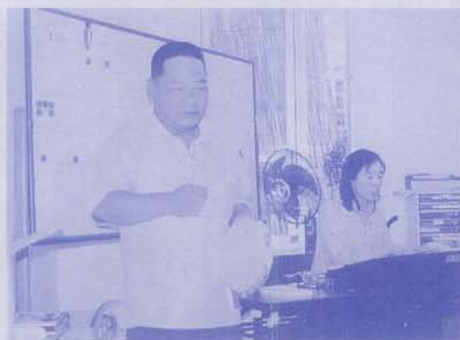
合唱練習 いっしょうけんめい歌ってます