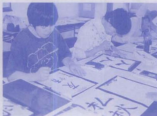
習字 真剣な顔で取り組んでいます