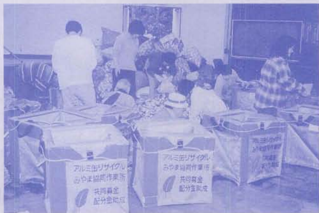
アルミ缶リサイクル 共同募金の助成でエコバックを購入