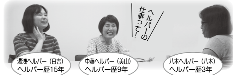
湯浅ヘルパー（日吉）ヘルパー歴15年