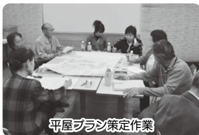
平屋プラン策定作業

昨年度に地区住民福祉活動計画「平屋プラン」を策定。「つながろう、ささえあおう」をスローガンに、健康づくり体操や高齢者等の暮らしの支援にもチャレンジされ、社協も協働して進めています。