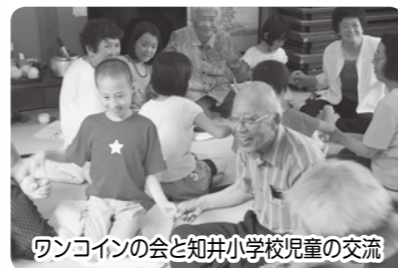
ワソコインの会と知井小学校児童の交流

支え合うしくみを作る地域福祉推進のために、平成23年に組織され、地区内の様々な団体と連携して取り組んでおられます。今年度は、集いの場へ参加者の移動支援のしくみづくりを社協と連携して進めています。