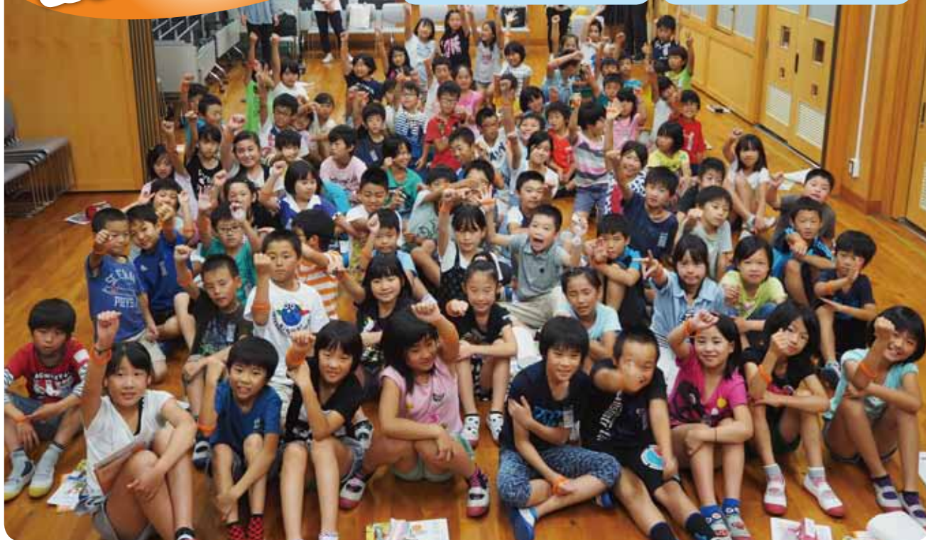
園部小学校 4年生 総合学習 「認知症サポーター養成講座」 (関連記事 6ページ)