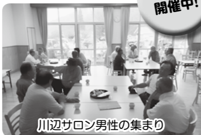
川辺サロン男性の集まり

小学校の再編を機に、川辺地区6区の高齢者が明るく元気にいきいきと暮らせる地域づくりをすすめるために結成されました。小学校を拠点に緊急時や災害時に支えあい助け合える、共助の基盤づくりに取り組むを進めておられます。