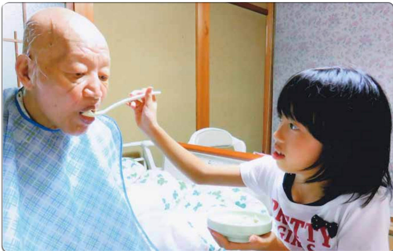
あったかなんたん介護フォトコンテスト最優秀賞『いっぱい、食べてね』