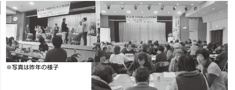
※写真は昨年の様子

お問い合わせは、南丹市社会福祉協議会 八木支所 電話／0771-42-5480 までお願いします。