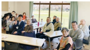
▲小山西町ふれあいいきいきサロン(ふれあいいきいきサロン活動助成)