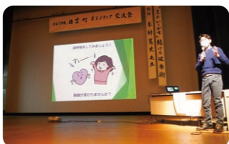
木村先生による講演