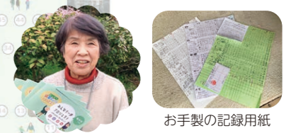
お手製の記録用紙