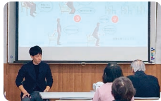
西岡先生による講演