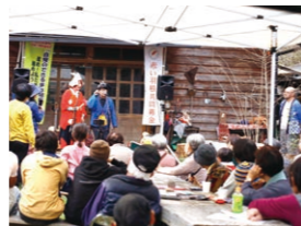
▲ワカチアイ(事業立上支援助成)