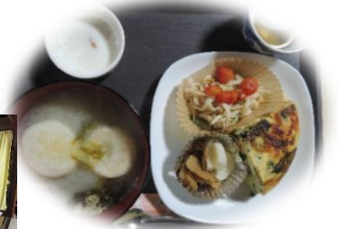
3/13(金)みんなでランチ