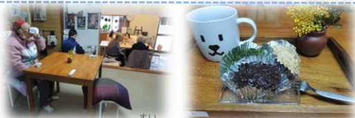
3/18(水)オープンカフェ