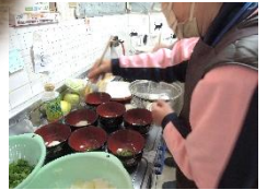
3/7(土)そよかぜどようび