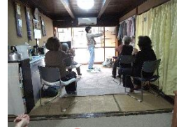
3/4(水)ストレッチ体操