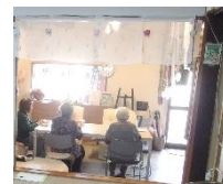
1/21(水) オープンカフェ

そよかぜは障がいのある方の社会参加を応援しています。 生きがい活動や交流を通して、お互いを理解し、支え合い の輪が広がればと願っています。 皆様のご参加お待ちしております。