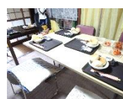
1/16(金) みんなでランチ