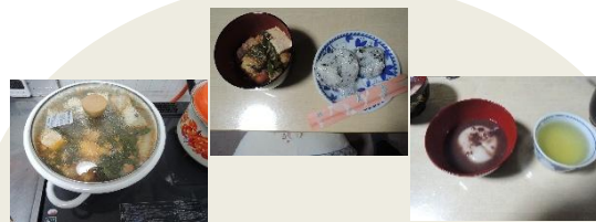
1/10(土) そよかぜ土曜日