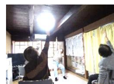
1/7(水) ストレッチ体操