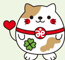
南丹市社協マスコット 「ニャンたん」

赤い羽根共同募金／歳末たすけあい募金にご協力いただきありがとうございました。 皆さまからお寄せいただいた募金は、南丹市内の人々を支える様々な福祉活動に役立てられます。