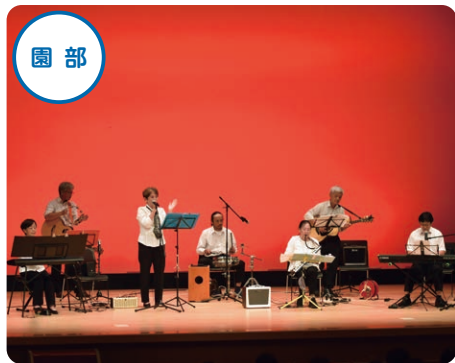
ふれあい楽団Luce（ルーチェ）