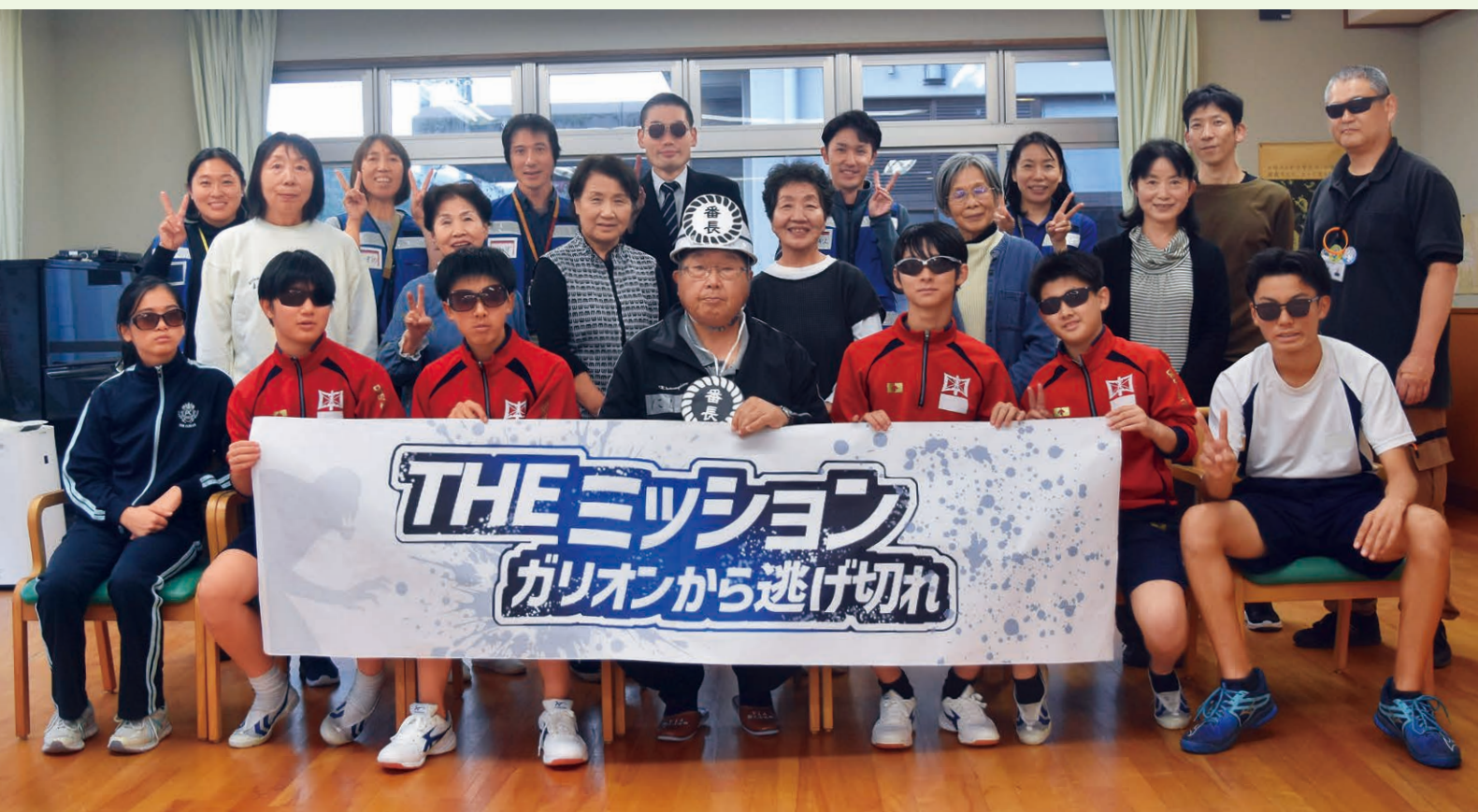
ボランティア・職員集合写真