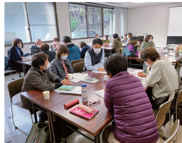
意見交流会の様子

意見交流会では、生活支援員それぞれが日々の支援で感じていることや困っていることなどを互いに共有し、交流を深めました。