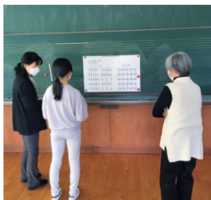
点字で暗号を読み解く