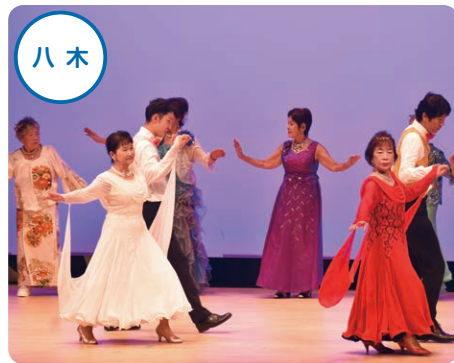
デイサービス支援ボランティア さくらんぼ