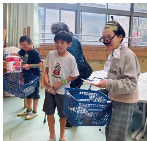
高齢者の買い物サポート