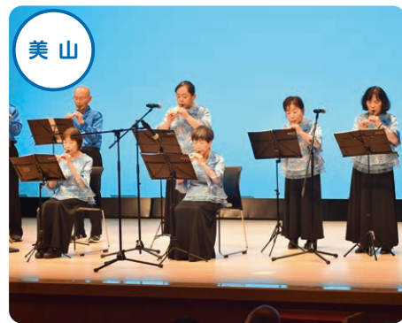
日本よし笛の会 京都美山教室