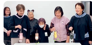
朗読と人形のおはなし会