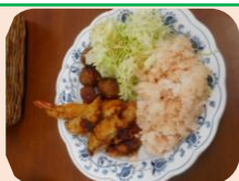
🎄 クリスマスランチ 🎄