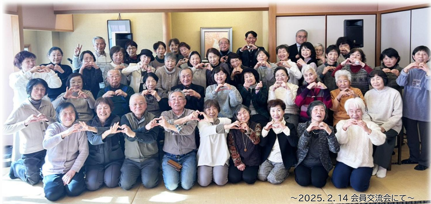
～2025. 2. 14 会員交流会にて～

京丹後市ボラ連はそれぞれ距離のある 6 町があり、うまく連携の取れない事もあるが、工夫してそれぞれ活動しているとの事でした。これからはより連携をしてお互いに深める事として散会となりました。とても有意義な会でした。