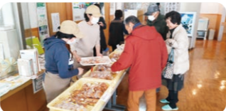
あゆみ工房の皆さんによるパン販売