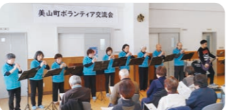
日本よし笛の会・京都美山教室