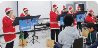
オカリナ演奏発表