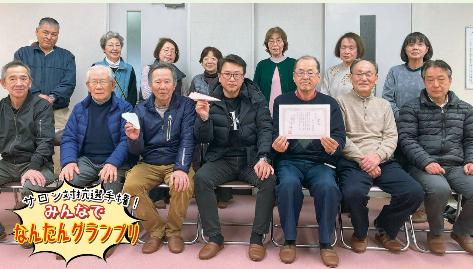
第3回 第1位入賞 サロン楽遊会 (八木町)