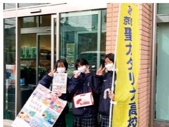
▲京都聖カタリナ高等学校街頭啓発活動