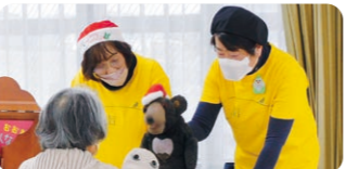
紙芝居・腹話術体験