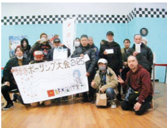
▲園部共同作業所ボーリング大会