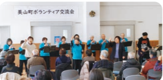
手話とよし笛のコラボ発表