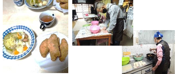
3/1(土)そよかぜ土曜日