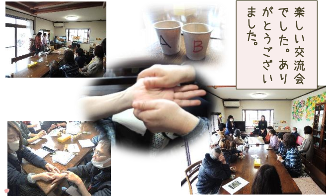
3/7(金)合同企画 ホーリーバズルでハンドマッサージ