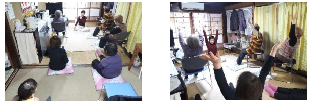
3/5(水)ストレッチ体操