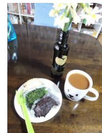
3/19(水)オープンカフェ