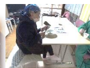
12/13(金)みんなでランチ