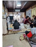
12/4(水)ストレッチ体操