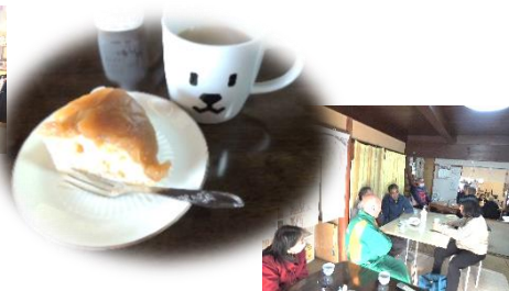
楽しい時間でした