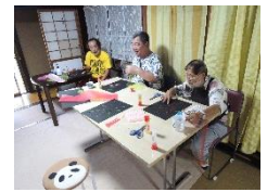
9/7(土) そよかぜ土曜日