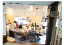
9/18(水)オープンカフェ