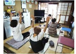
9/4(水)ストレッチ体操