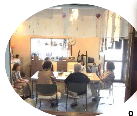
すい 8/21(水)オープンカフェ