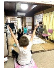
すい たいそう 8/7(水)ストレッチ体操