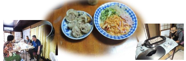
ど どよろび 8/3(土)そよかぜ土曜日