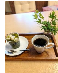
5/15(水) オープンカフェ