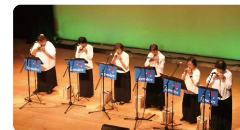
「オカリナ演奏」らべんだ〜ず(園部)