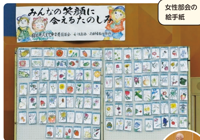
女性部会の 絵手紙