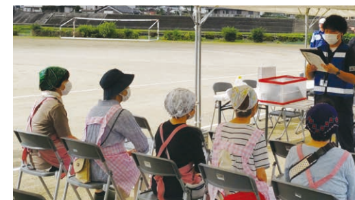
▲ボランティアへの説明の様子