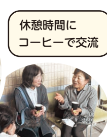
休憩時間に コーヒーで交流