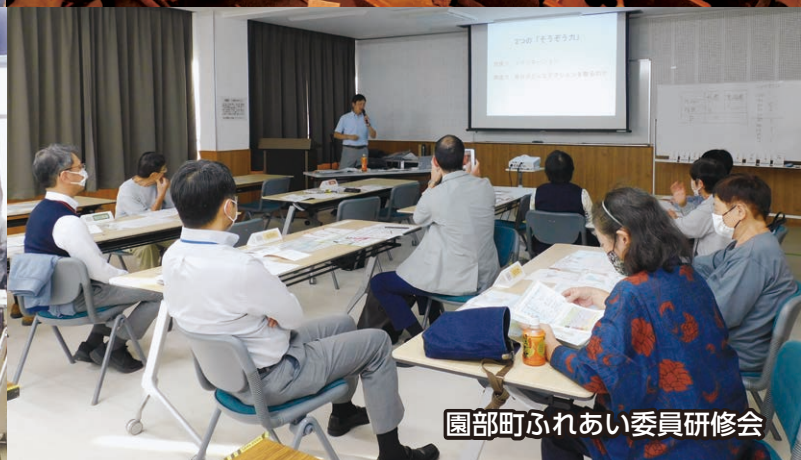
園部町ふれあい委員研修会