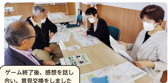
ゲーム終了後、感想を話し 合い、意見交換をしました