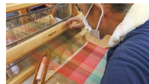
▲自主事業のさをり織