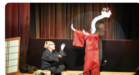
「人形劇」おむすび(美山)