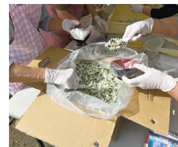
▲アルファ化米をおにぎりにして提供