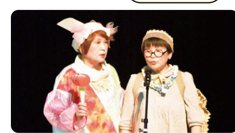
「漫才」花いちもんめ(日吉)