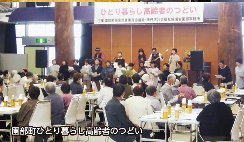
園部町ひとり暮らし高齢者のつどい