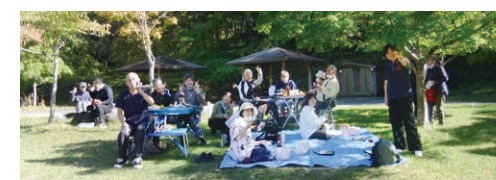
▲日吉ダムヘビクニック