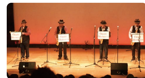
「サックス演奏」クレージーモンキーズ(園部)