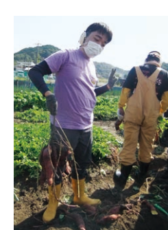
▲地域交流での芋掘り