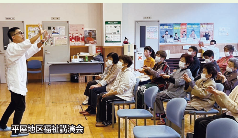
平屋地区福祉講演会