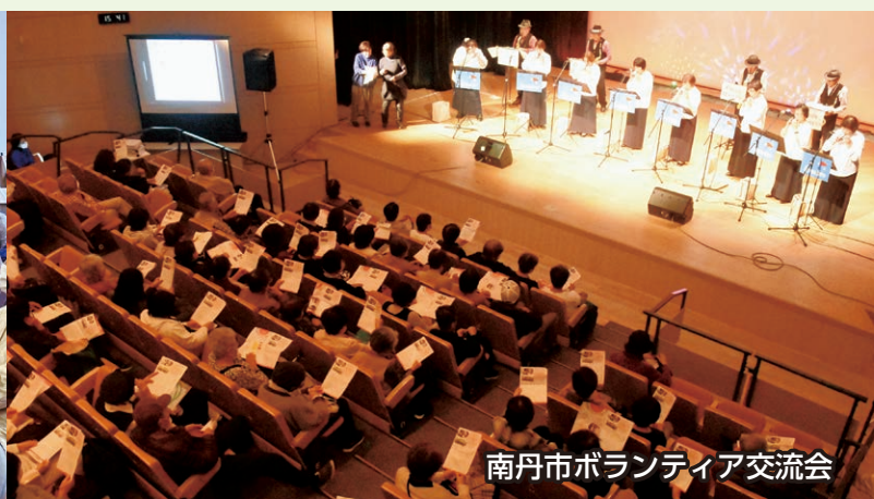
南丹市ボランティア交流会