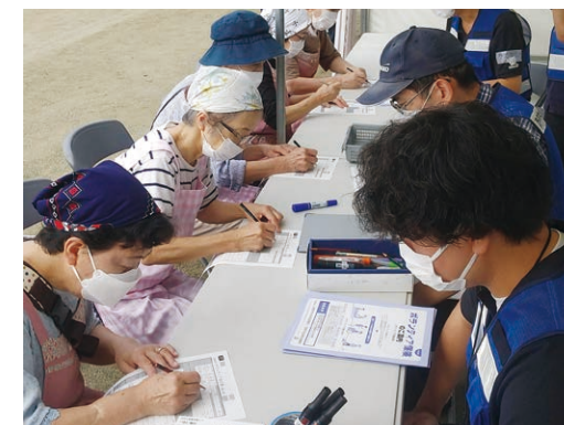
▲ボランティア受入の様子