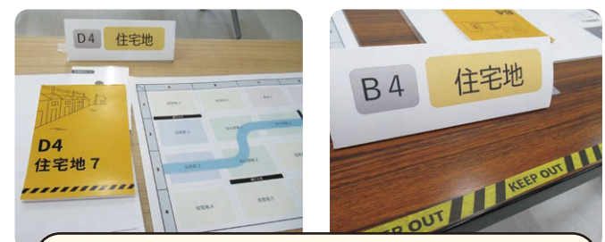
机をひとつの地域として考えます 通行止めもあります

「風水害24」とは、命を脅かすレベルの風水害の接近から直撃・通過までの24時間に、情報を収集・判断・行動することで、自分の身を守りながら、地域の安全を考えるゲームです