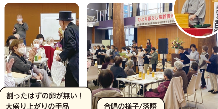
割ったはずの卵が無い！ 大盛り上げりの手品