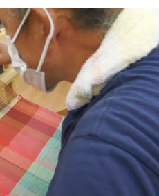
▼さをり生地を縫製