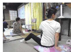
9/6(水) ストレッチ体操