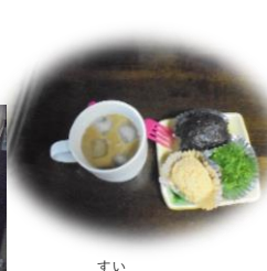
9/21(水) オープンカフェ