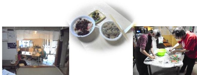
9/2(土) そよかぜどうぶつ