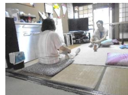
8/2(水) ストレッチ体操