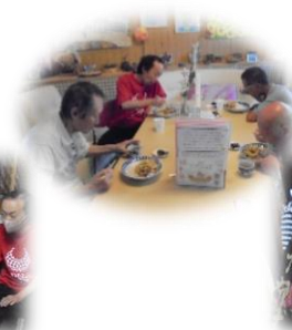
8/5(土) そよかぜ土曜日