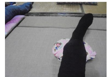
4/5(水)ストレッチ体操