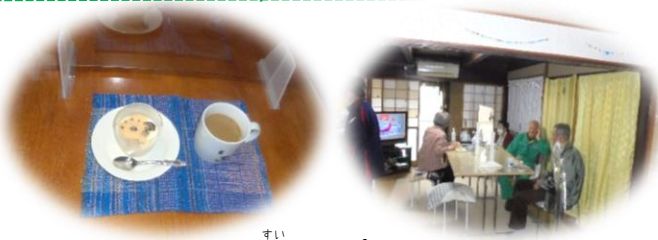
4/19(水)オープンカフェ

そうだんび ~なんでも相談日~ がつ にち げつ こごじ こごじ 5月22日(月) 午後1時~午後3時