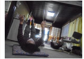
3/1(水)ストレッチ体操