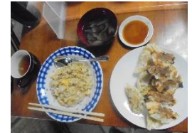
3/4(土)そよかぜ土曜日