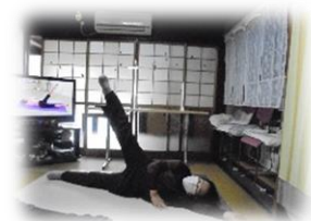
2/1(水) ストレッチ体操