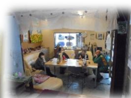
2/15(水) オープンカフェ