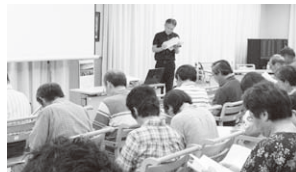
▲令和元年度 園部町摩気地区の懇談会