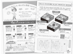
▲令和3年度に発行した あんしんあんぜん情報

毎月、健康や防災情報、脳トレク イズなどを掲載した「あんしんあ んぜん情報」を発行し、ふれあい 委員さん、民生児童委員さんの見 守り訪問の時にご活用いただいて います。