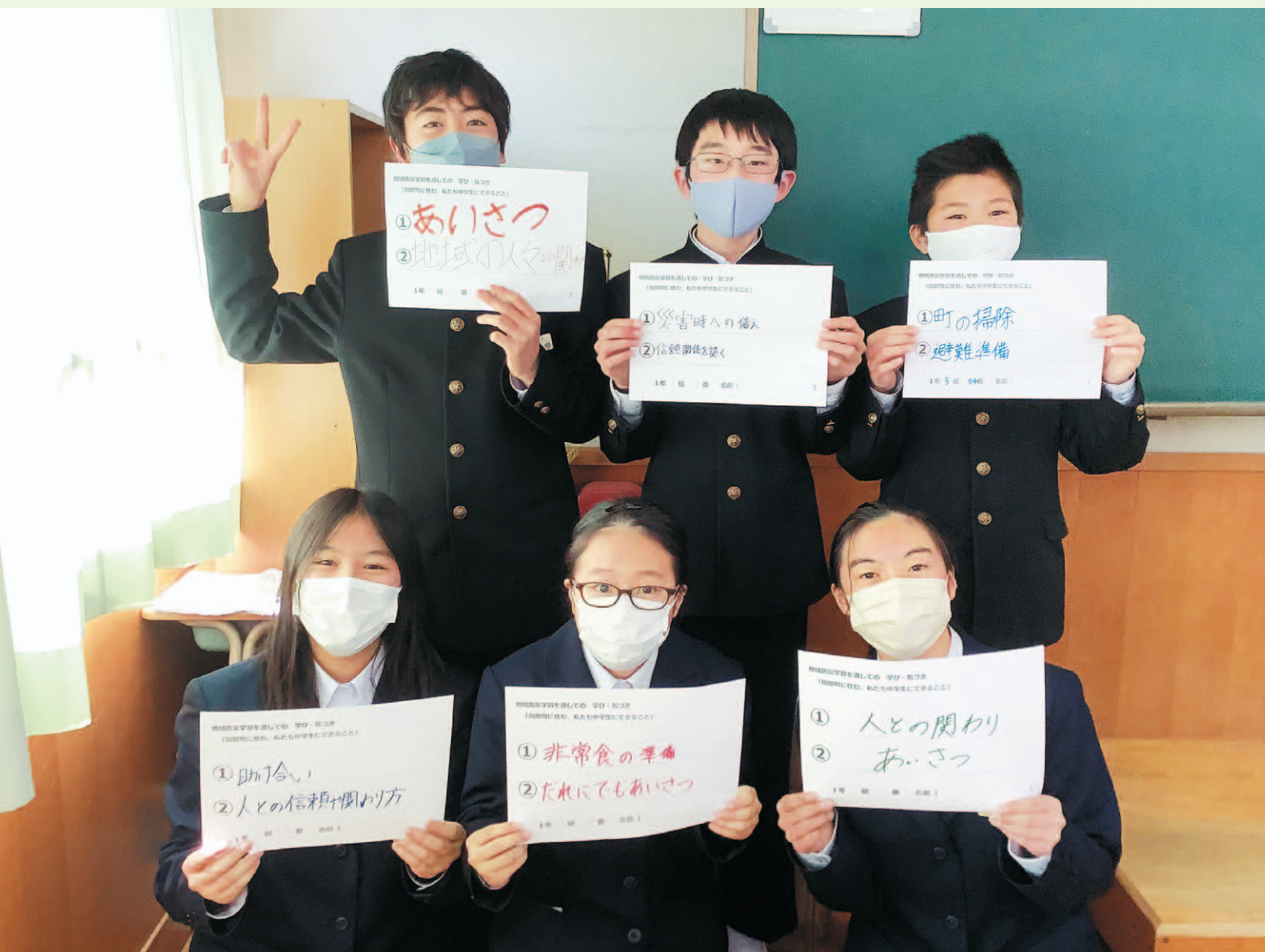
園部中学校での防災教育の様子