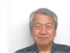
宿直 くぜ こうじ