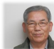
宿直 たい 保