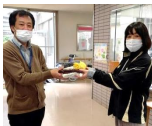
はぎの里三好施設長

認知症マフとは…毛糸などでつくられた筒状のニット製品で、手を通した人は気持ちよさに安心感が得られるそうです。