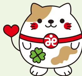
南丹市社協マスコット 「ニャンたん」