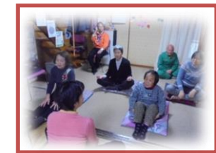
1/20(月)ストレッチ体操