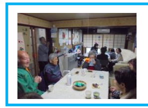
1/22(水)オープンカフェ