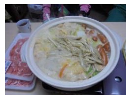
1/4(土)そよかぜ土曜日