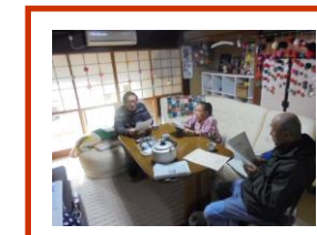
11/14(水)うたをうたおう