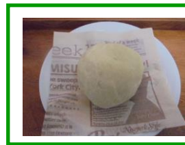
11/21(水)オープンカフェ