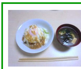
11/3(土)そよかぜ土曜日