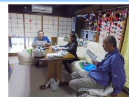
10/10(水) うたをうたおう