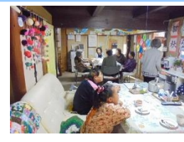
10/17(水) オープンカフェ