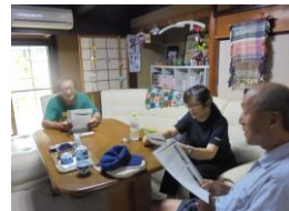
8/8(水) うたをうたおう