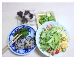
8/4(土) そよかぜどようび