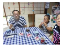
8/15(水) オープンカフェ