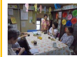
7/18(水) オープンカフェ