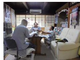
7/11(水) うたをうたおう