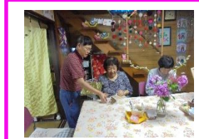
6/20(水)オープンカフェ