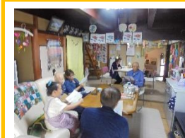
6/13(水)うたをうたおう