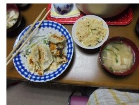
6/2(土)そよかぜどようび