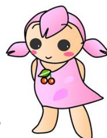
南丹市イメージキャラクター さくらちゃん

日吉事務所 | 0771-72-0214 美山事務所 | 0771-75-1006