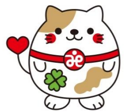
南丹市社協マスコット ニャンたん