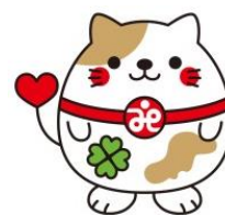
南丹市社協マスコット ニャンたん