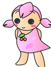
南丹市イメージキャラクター さくらちゃん

日吉事務所 | 0771-72-0214 美山事務所 | 0771-75-1006