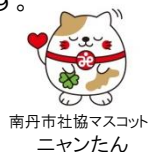
南丹市社協マスコット ニヤンたん

※地域包括支援センターは 介護保険法に基づいて市町村が設置しています。 南丹市では委託を受けて、 南丹市社会福祉協議会が運営しています。