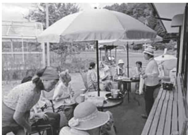
花づるカフェのようす（8月21日撮影）

「美しい集落づくり・地域の憩いの場づくり」を合言葉に、植栽ボランティア活動を15年間続けています。