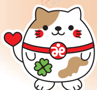
南丹市社協マスコット 「ニャンたん」