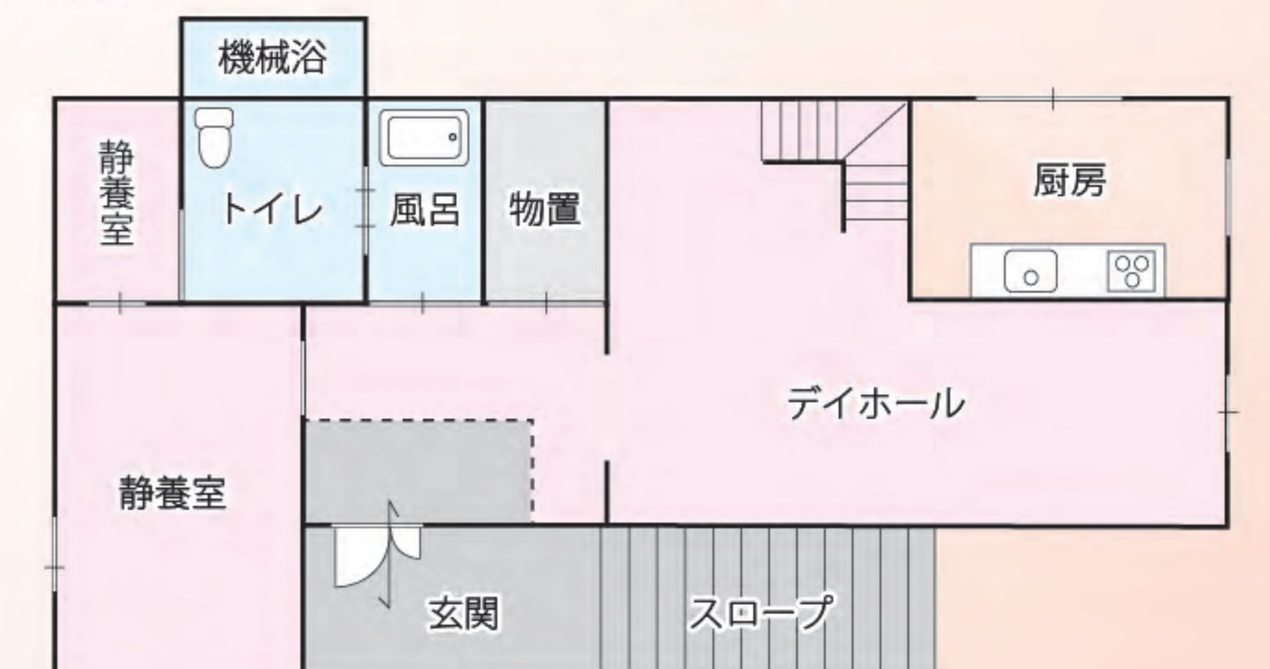
デイ施設の間取り図

営業日 月曜日～金曜日 休業日 土/日曜、年末年始(12/29～1/3の6日間) 営業時間 午前9時30分～午後5時30分 〈電話 0748-53-8711 FAX 0748-53-2346〉