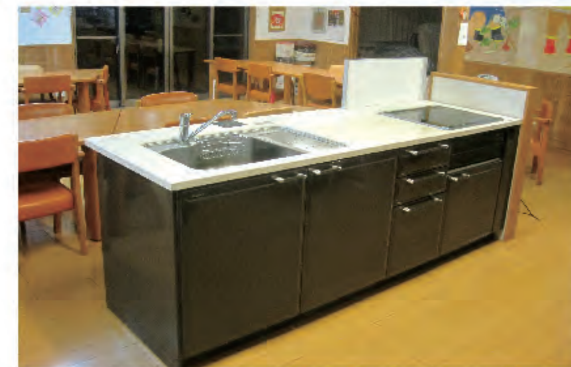
アイランドキッチン

営業日 月曜日～土曜日(祝日も利用可) 休業日 日曜日、年末年始(12/30～1/3の5日間) 利用定員 34名 サービス提供時間 午前9時15分～午後4時30分 〈電話 0748-42-1777 FAX 0748-42-5777〉