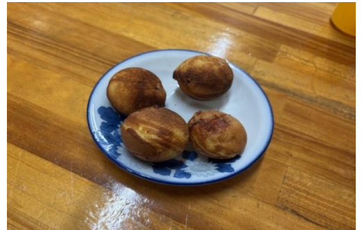
7日 ベビーカステラ