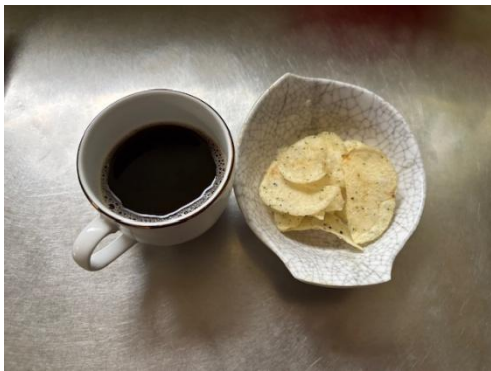
16日 コーヒーセット