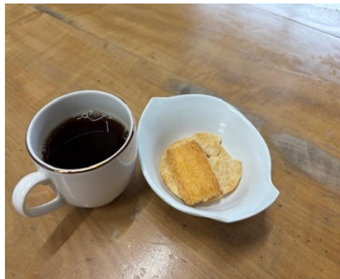
9日 コーヒーセット