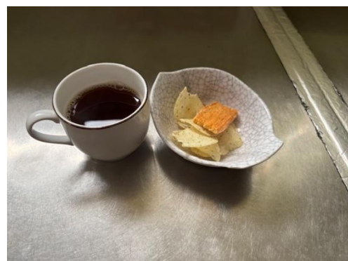
20日 コーヒーセット