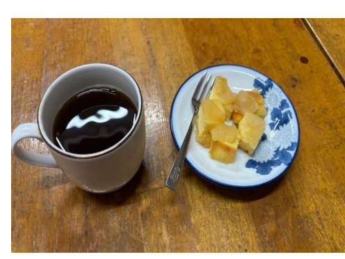
23日 コーヒーセット