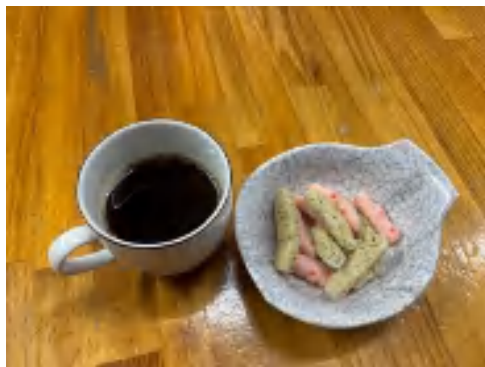
23日コーヒーセット