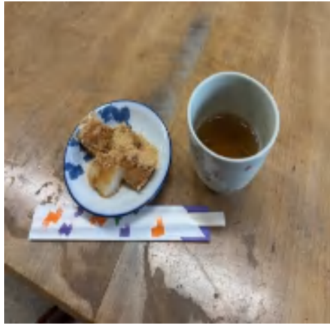
6 日 きな粉餅