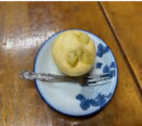
12 日 芋蒸しパン