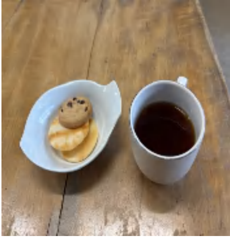
5 日 コーヒーセット