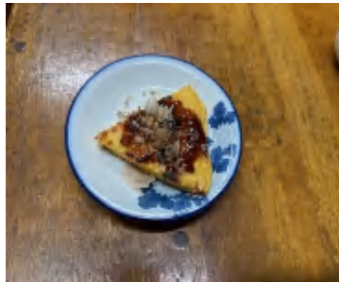
13 日 お好み焼き