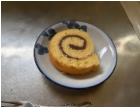
8 日 ロールケーキ