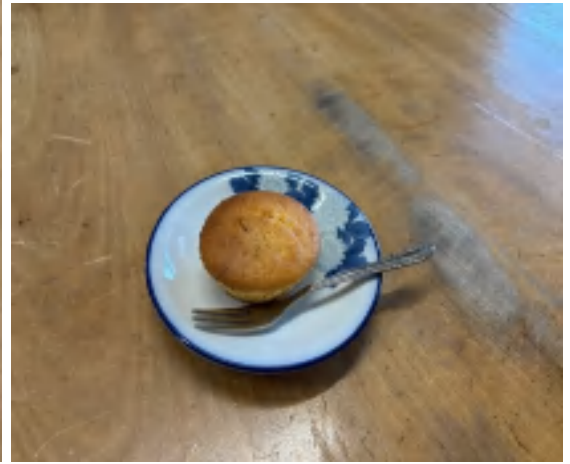
7 日 カップケーキ