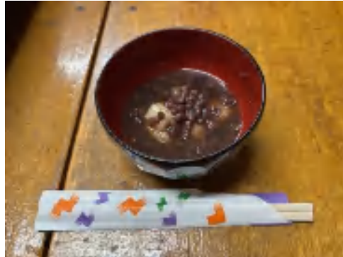
9 日 ぜんざい