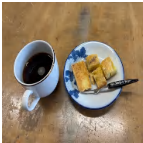
16日 コーヒーセット