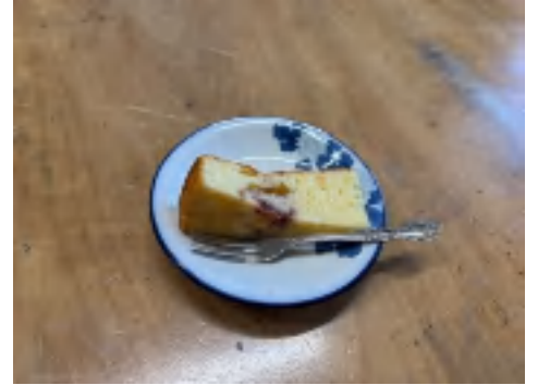
10 日 ケーキ