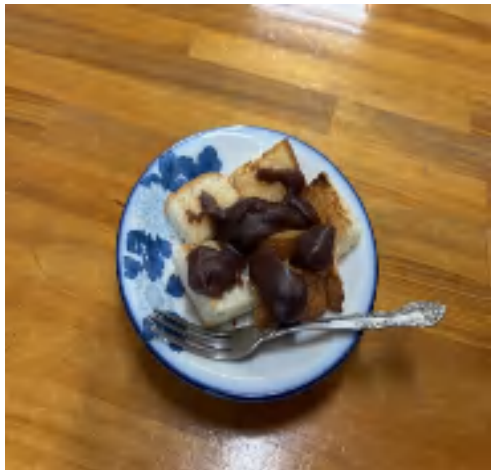
22 日 トースト