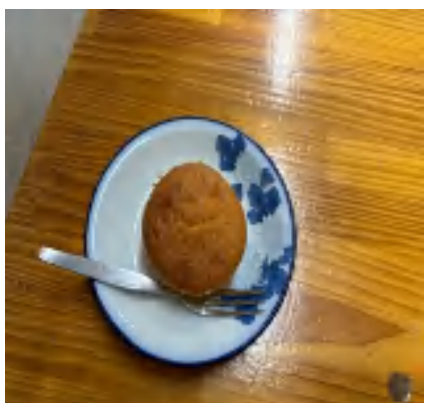
29 日 カップケーキ