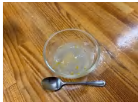
24 日 ゼリー