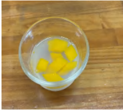
2日 マンゴーゼリー