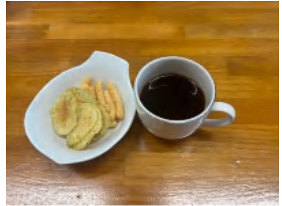
3日 コーヒーセット