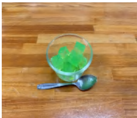
30 日 寒天