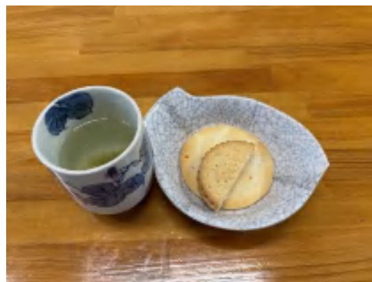
28 日 昆布茶セット