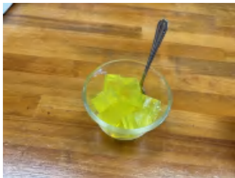
23 日 レモン寒天