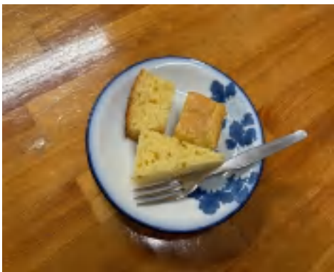
25 日 ケーキ