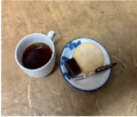
1日 コーヒーセット