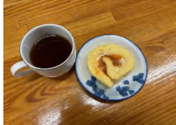
7日 コーヒーセット