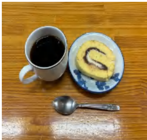
13日 コーヒーセット