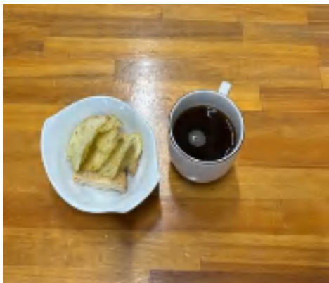
5日 コーヒーセット