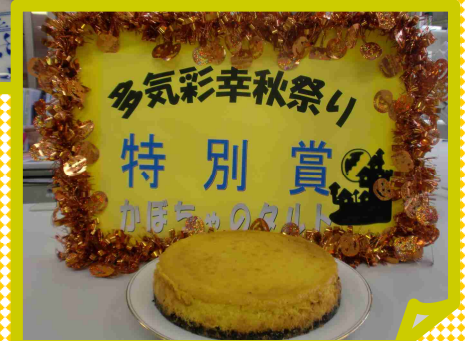
10月 秋祭り特別賞 手作りおやつ かぼちゃのタルト