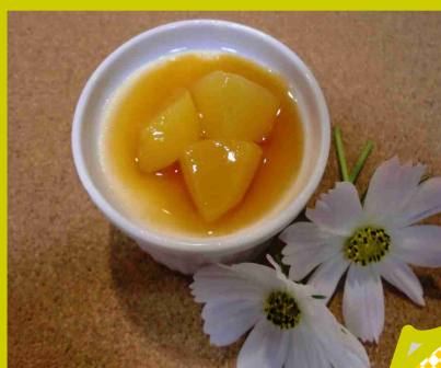
↑8月 手作りなめらか プリン