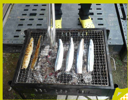
↑9月・10月 秋刀魚の塩焼き 炭火焼で秋の味覚をより美味しく〜