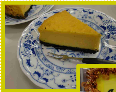
←かぼちゃのタルト