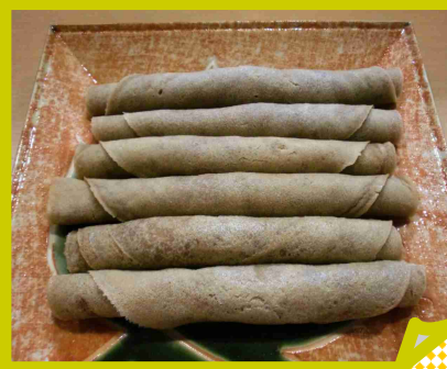
↑8月 沖縄おやつ 沖縄の家庭のおやつ、ちんびんです。ちんすこうも手作り！