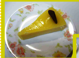
↑夏色★ ハワイアケーキ