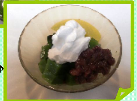
涼しげな クリームあんみつ♪

↑6月：利用者様と職員でいろいろなサンドイッチを作り、楽しみながら召し上がって頂きました。