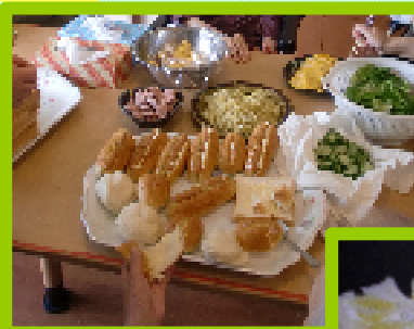
←皆でわいわい サンドイッチ作り

↑5月：手打ちうどんに挑戦しました。手作りのいばらまんじゅうは、懐かしい味と好評でした。