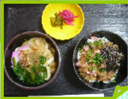
←ねぎとろ丼も 作り、定食に☆