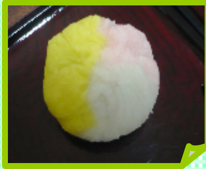
←4月：春の和菓子作り

色鮮やかな草花に春を感じる季節です。 季節感のあるおやつを提供したいと思い、 春の色合いの練りきりを手作りさせて頂きました。