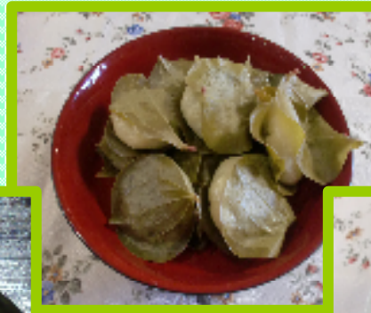
←手作りの いばらまんじゅう