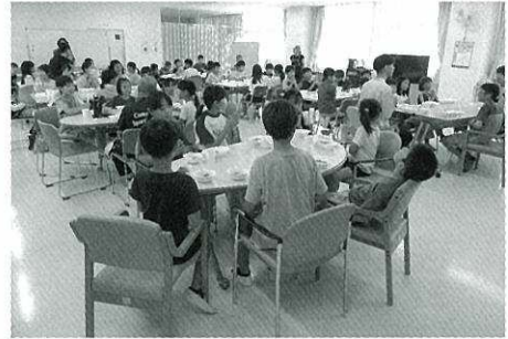
R7 こども食堂の様子