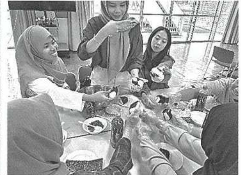
外国籍住民支援事業