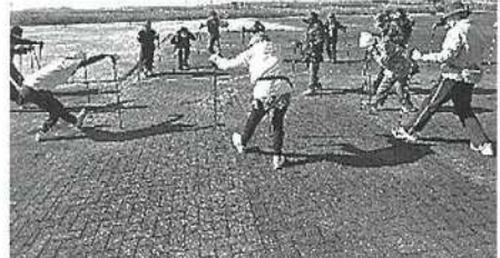
R5 シニアカレッジの様子