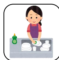
キッチンの片づけ