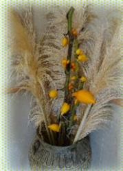
フォックスフェイス