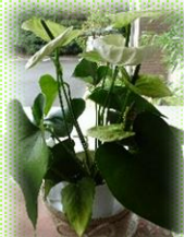
アンズリウム ホワイト