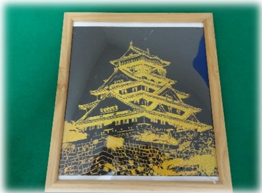
スクラッチアート『大阪城』