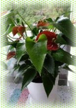
アンズリウム レッド