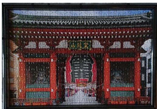
パズル作品 — 浅草雷門 —